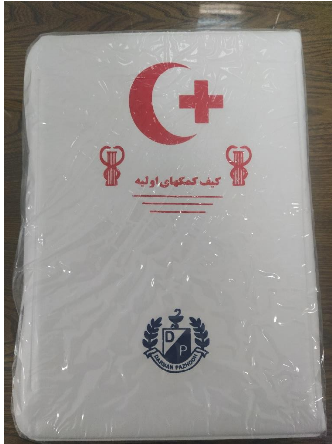
کیف کمک های اولیه